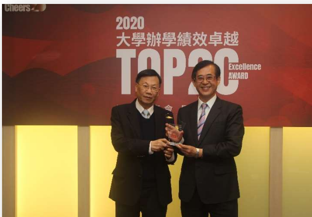
圖：大學辦學績效 TOP20，全台第 9 名！