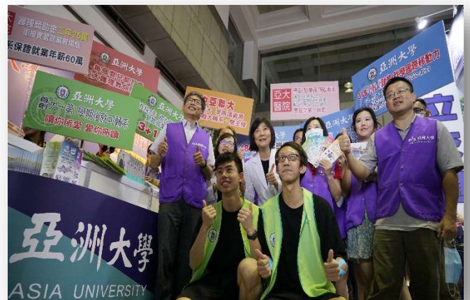
圖：招生處行政團隊參加大學博覽會