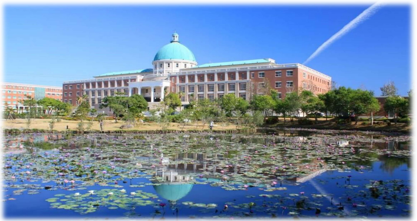
圖：就讀亞大，宛如就讀一所「綜合大學」+「醫學大學」+「國際大學」