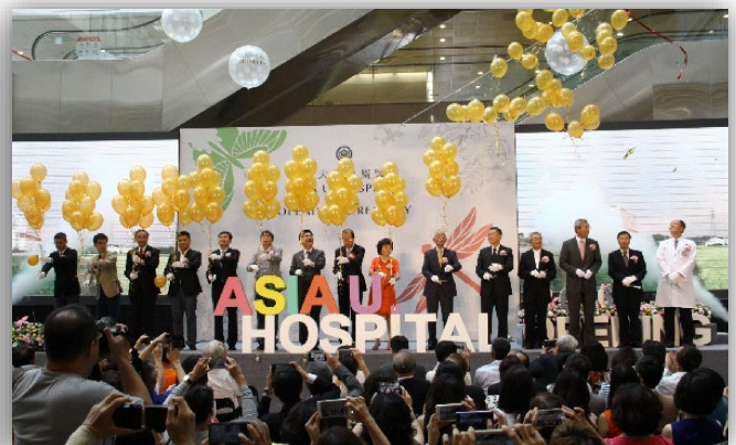
圖：亞洲大學附屬醫院