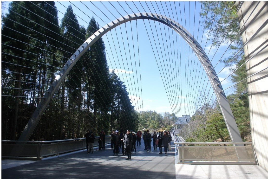
圖說：亞大室內設計系 2018 日本關西建築見習之旅，到 MIHO 美秀美術館參觀合影。

福田知弘教授團隊利用時下最新的 VR 虛擬實境技術重新規劃境港縣主要街道，並將動漫空間藝術品主題化，將所有人們喜愛的妖怪集中並分區，形成妖怪主題街讓群眾更容易親近，目前妖怪主題街的遊客量，已經達到每年 300 萬人次遊客。