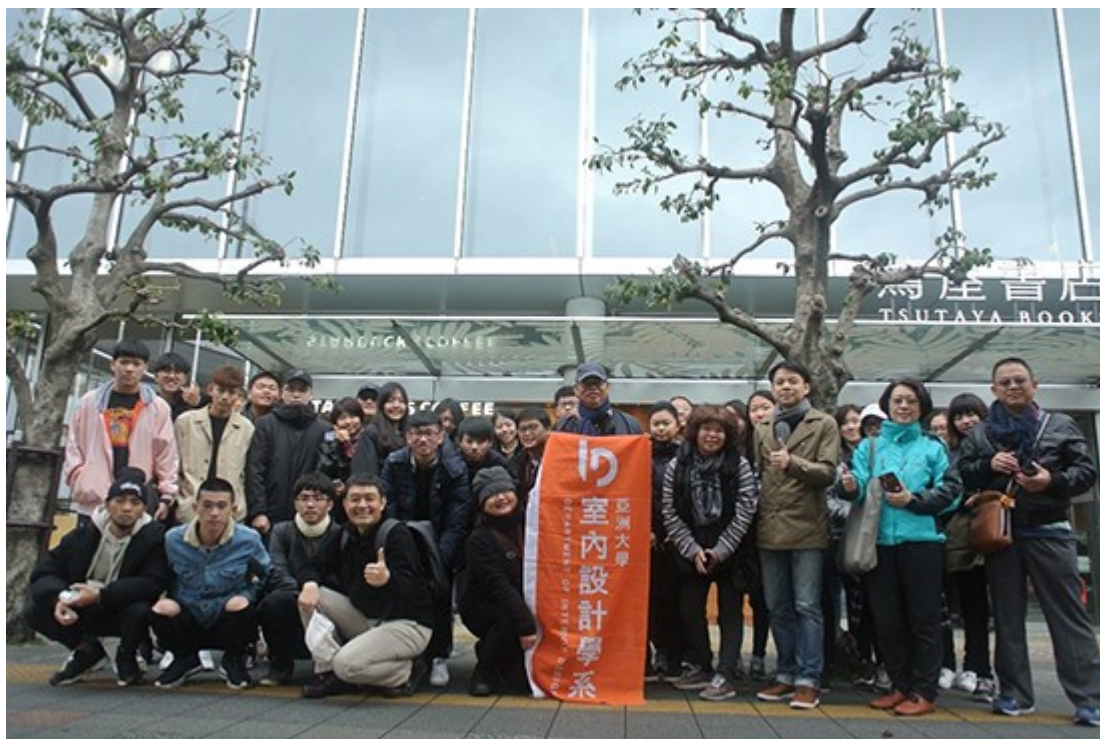
圖說：亞大室內設計系 2018 日本關西建築見習之旅，首站到蔦屋書店參觀。