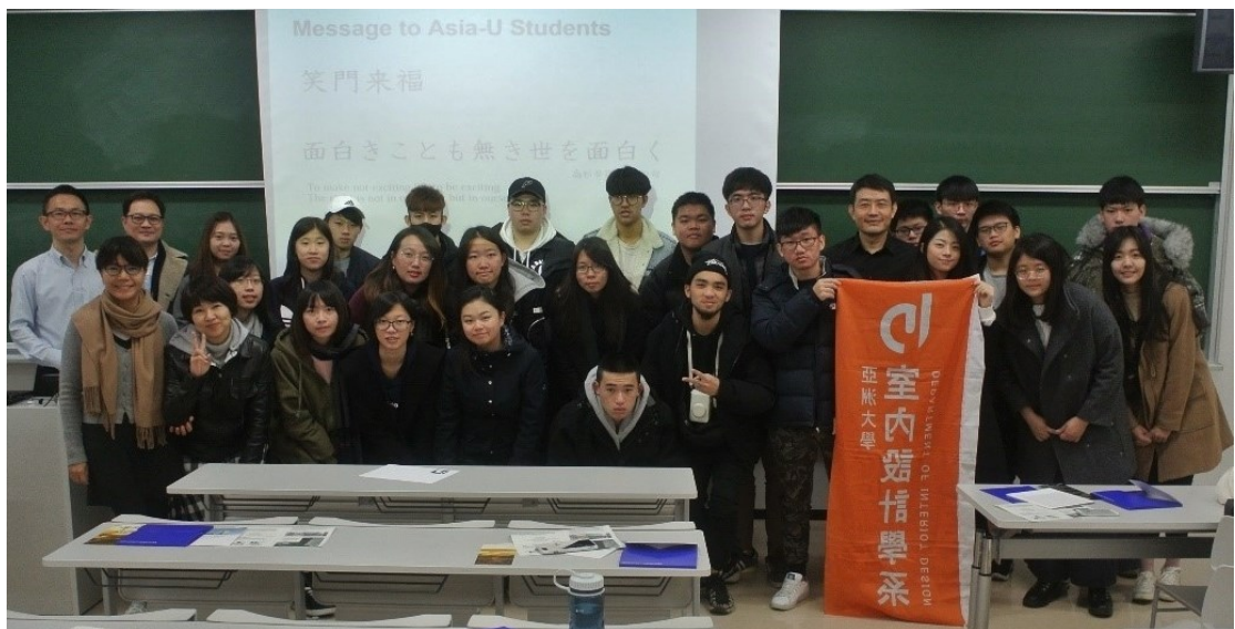
圖說：亞大室內設計系建築美學見習團的師生和福田教授研究室成員合影。